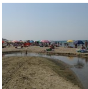
Foce Fosso vietato alla balneazione

Da De Fusco a Fucci ... "mare eccellente" ed i cittadini non lo capiscono !