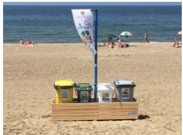
Raccolta differenziata a Torvaianica

Parliamo di litorale. L'estate appena trascorsa ha presentato parecchie novità, due su tutte: le torrette di controllo e la raccolta differenziata sugli arenili liberi. State pensando anche ad altro per rilanciare un'area strategica come quella di Torvaianica?